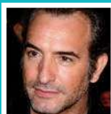
Jean Dujardin acteur