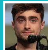
Daniel Radcliffe acteur