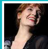
Florence Welch chanteuse de Florence + The machines