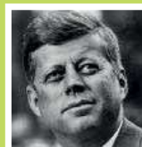
John F. Kennedy